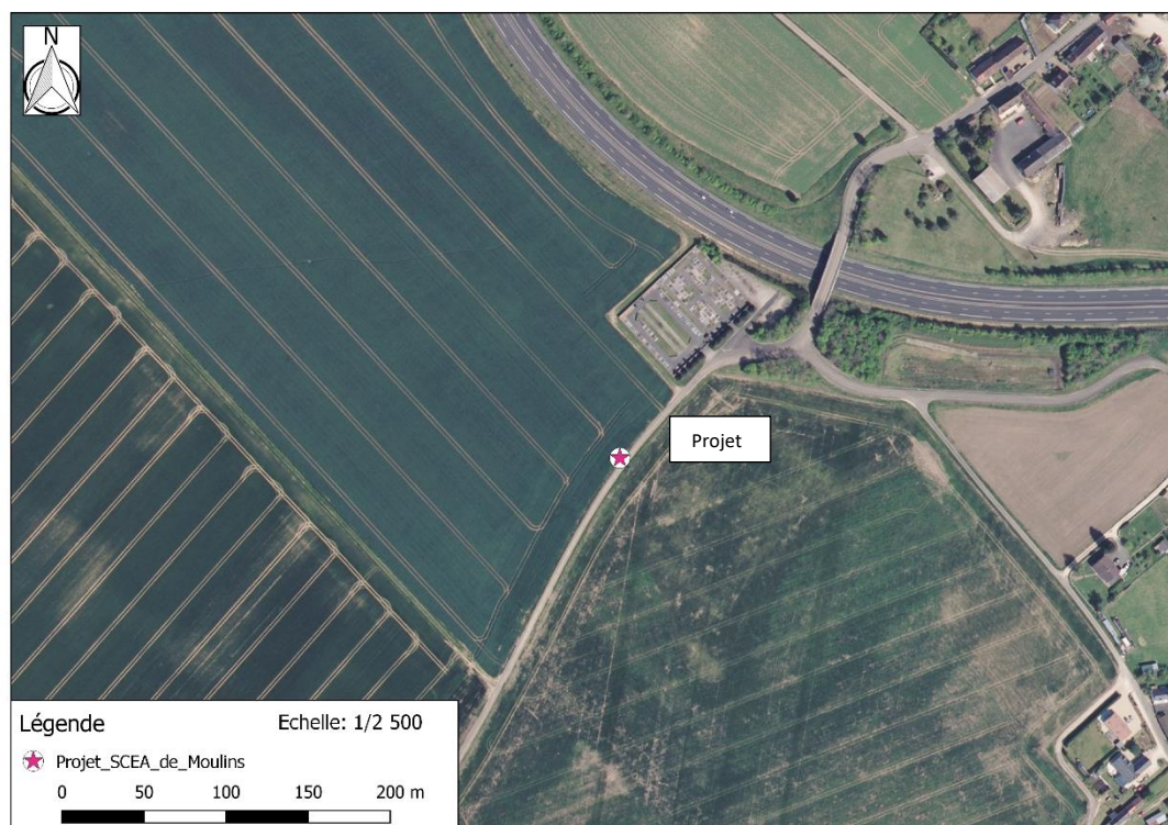
Photographie aérienne extraite de la BDORTHO IGN de 2015 permettant de situer le projet (en rose) dans son environnement proche