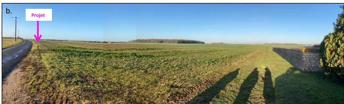
Photographies de Juillet 2012 permettant de situer le projet dans son paysage lointain (sens inverse de la vue précédente : a – Source : Google Street View), et Photographie du 20 Janvier 2022 (b) prise par la Chambre d'agriculture du Loiret.