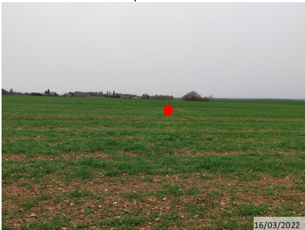
Emplacement 1 :