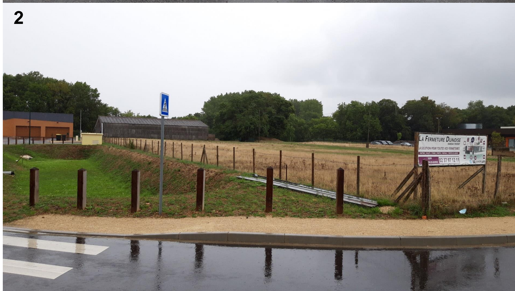
Photographie du site depuis la Route Nationale (Septembre 2022 – SOCOTEC)