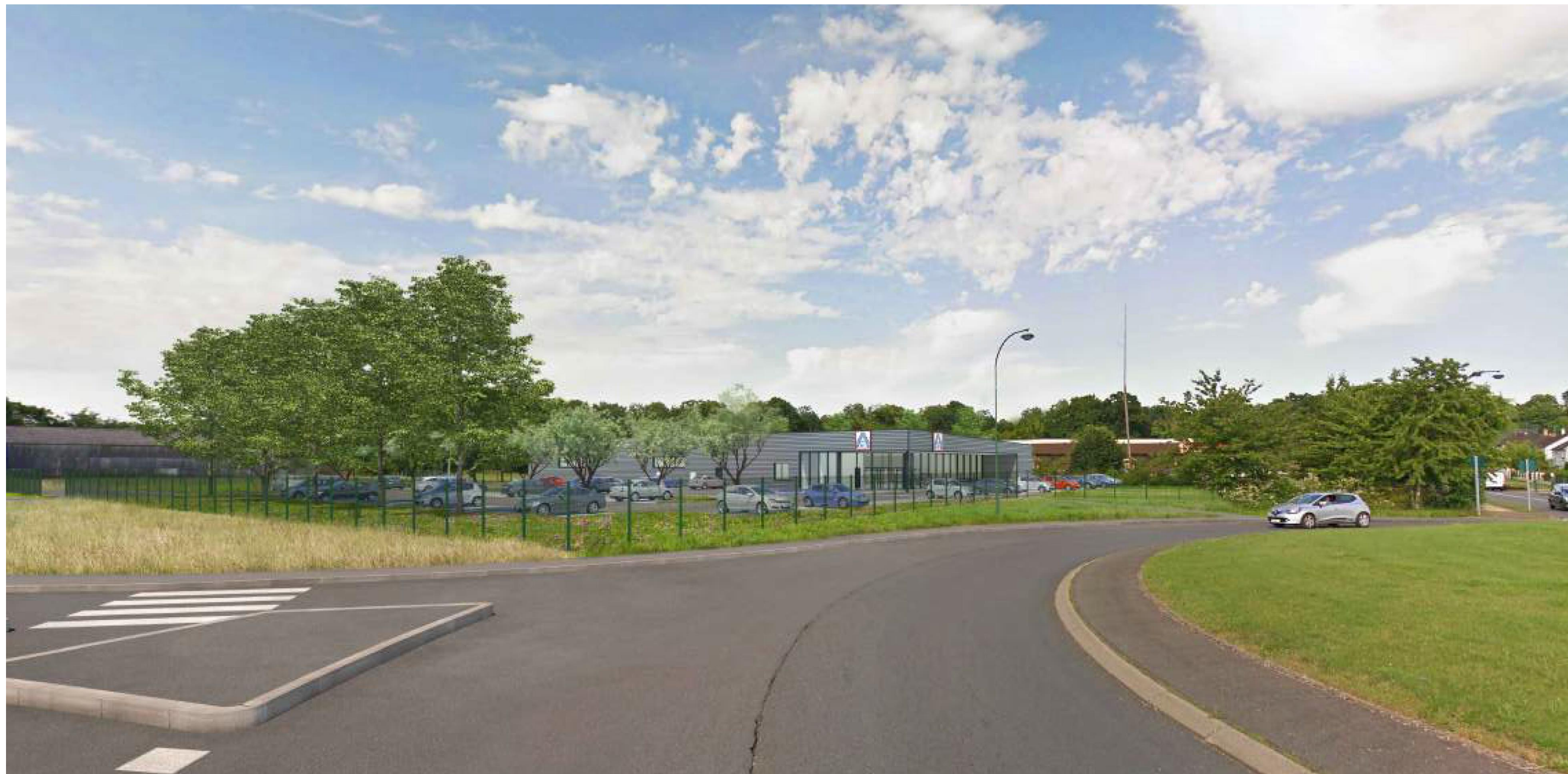
Figure 2 : Vues d'insertion du projet