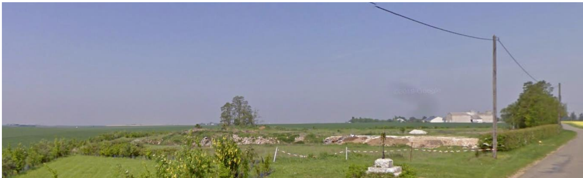
P1 : Prise de vue rapprochée (11/04/22)