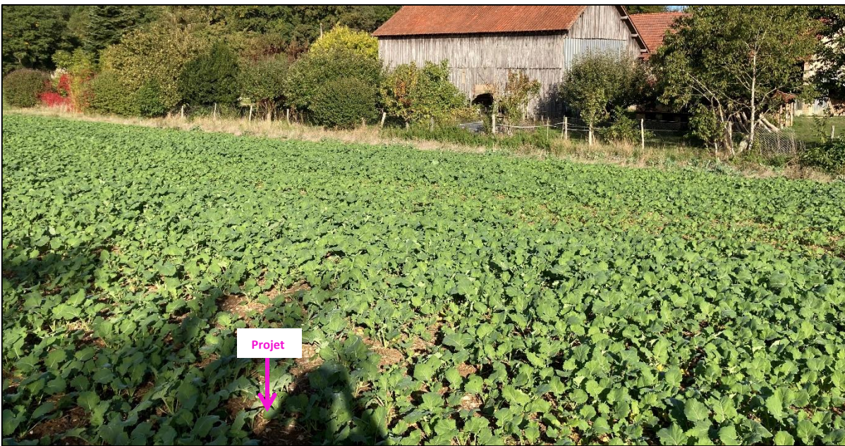
Photographies du 06 octobre 2022 permettant de situer le projet dans son environnement proche