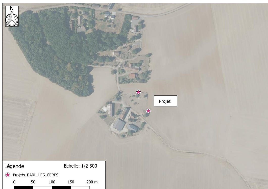
Photographie aérienne extraite de la BDORTHO IGN de 2015 permettant de situer le projet (en rose) dans son environnement proche