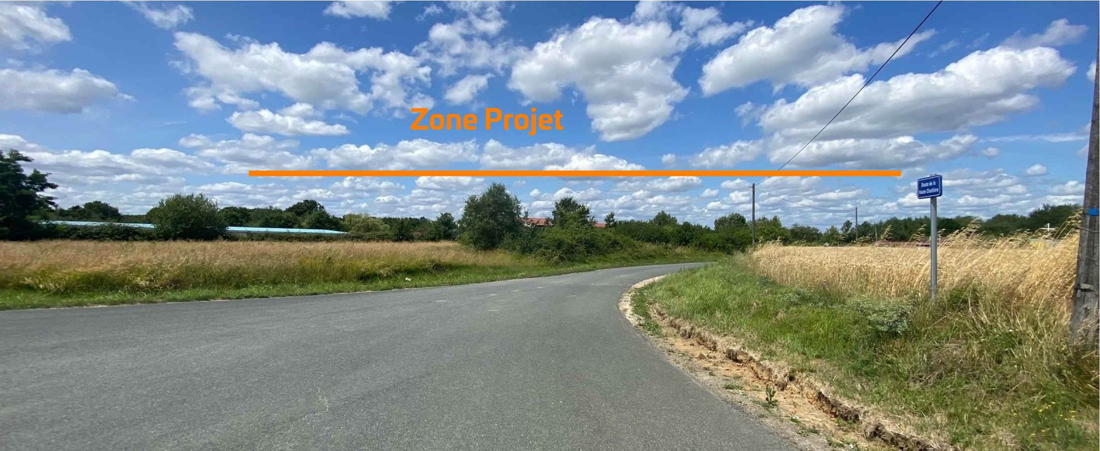
PDV 2 - Localisation du projet dans son environnement moins proche