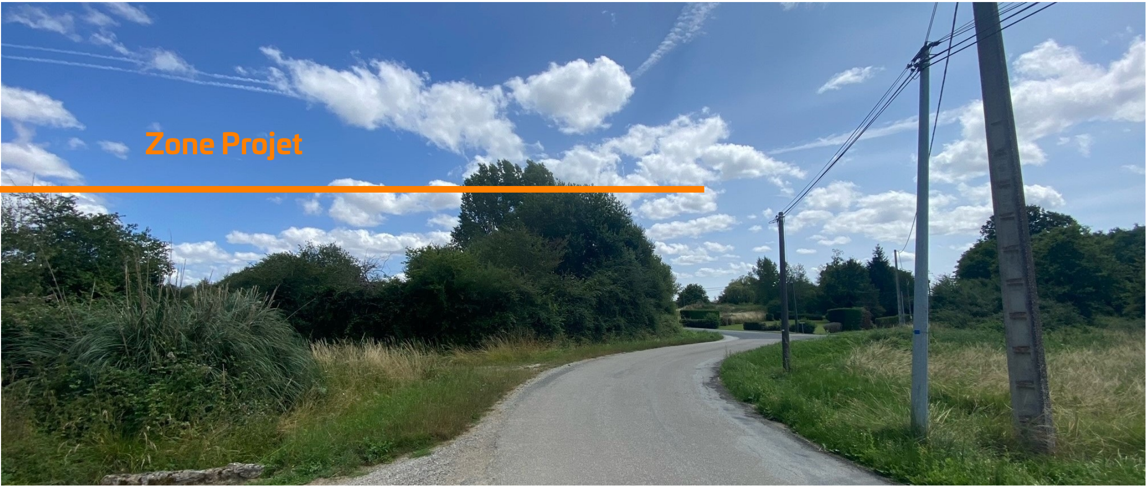
PDV 1 - Localisation du projet dans son environnement proche