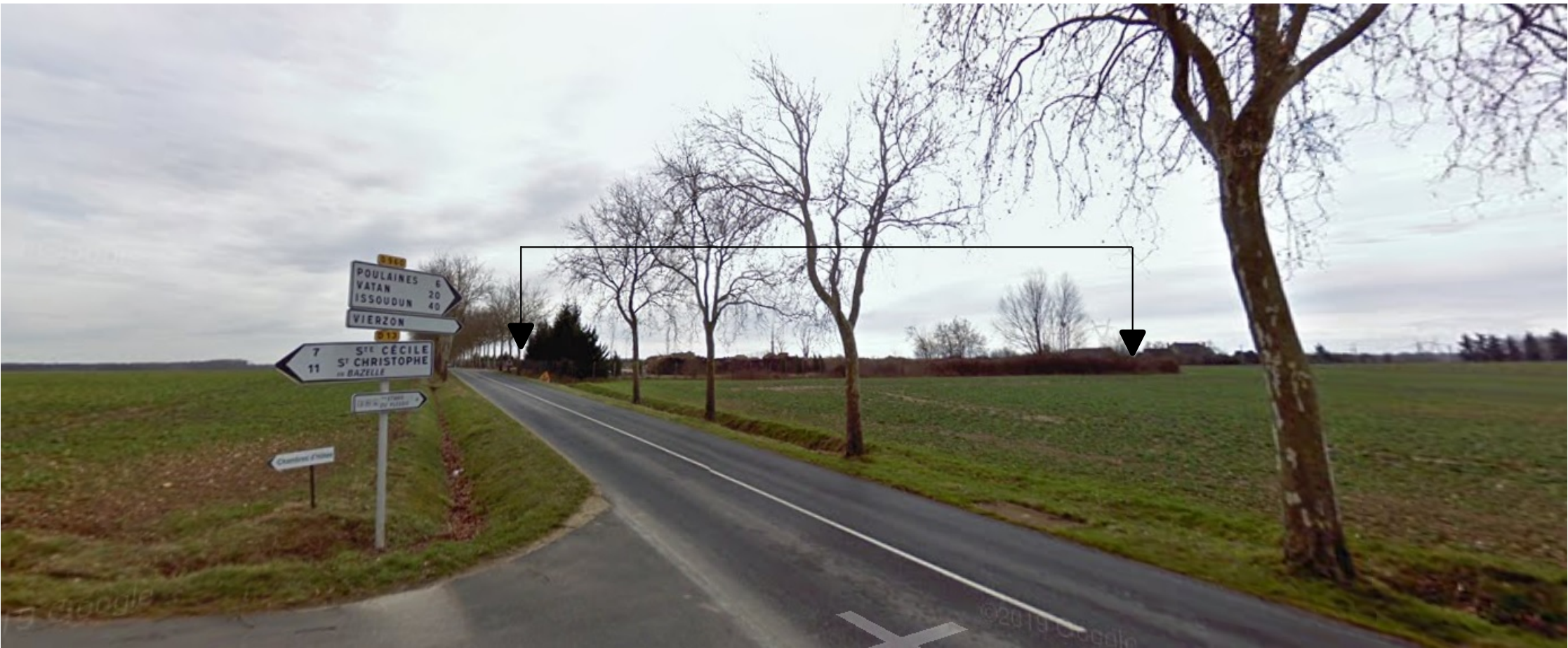
PDV 1 - Localisation du projet dans son environnement proche