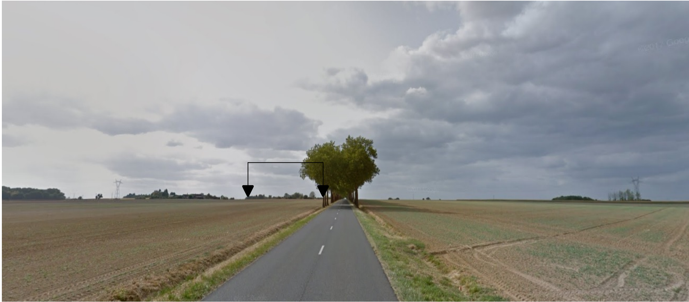
PDV 2 - Localisation du projet dans son environnement lointain