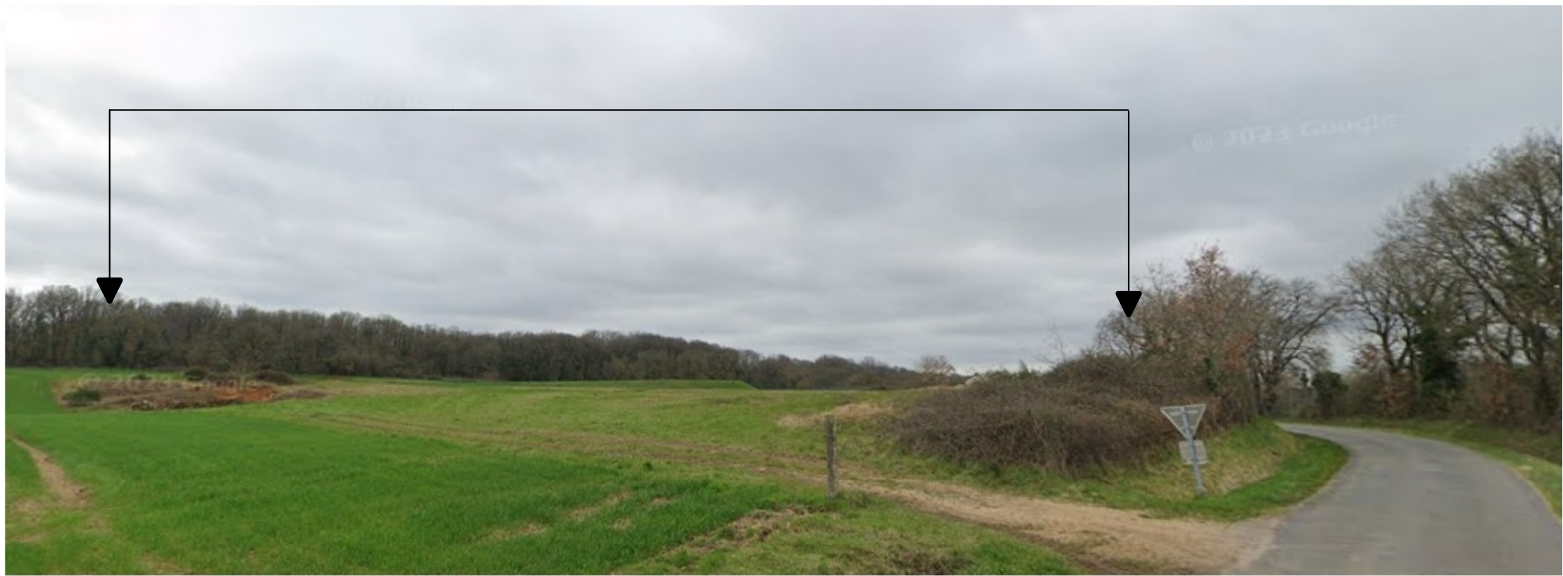
PDV 1 - Localisation du projet dans son environnement proche