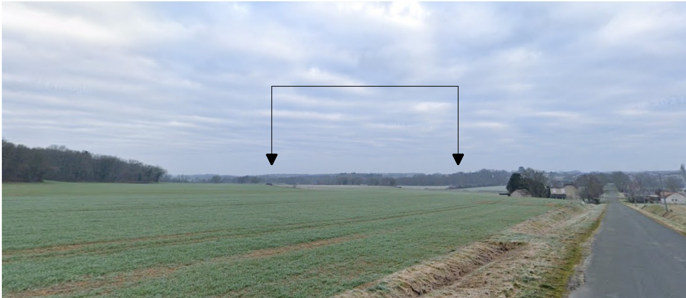
PDV 2 - Localisation du projet dans son environnement lointain