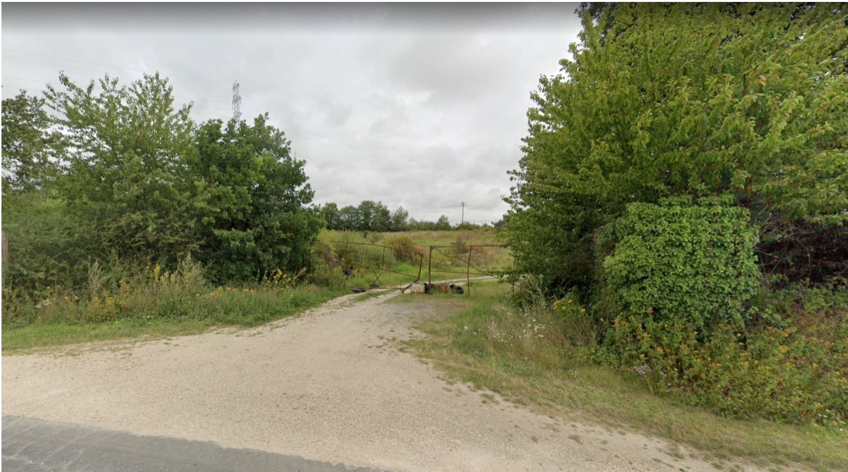
PDV 1 - Localisation du projet dans son environnement proche (avril 2023)