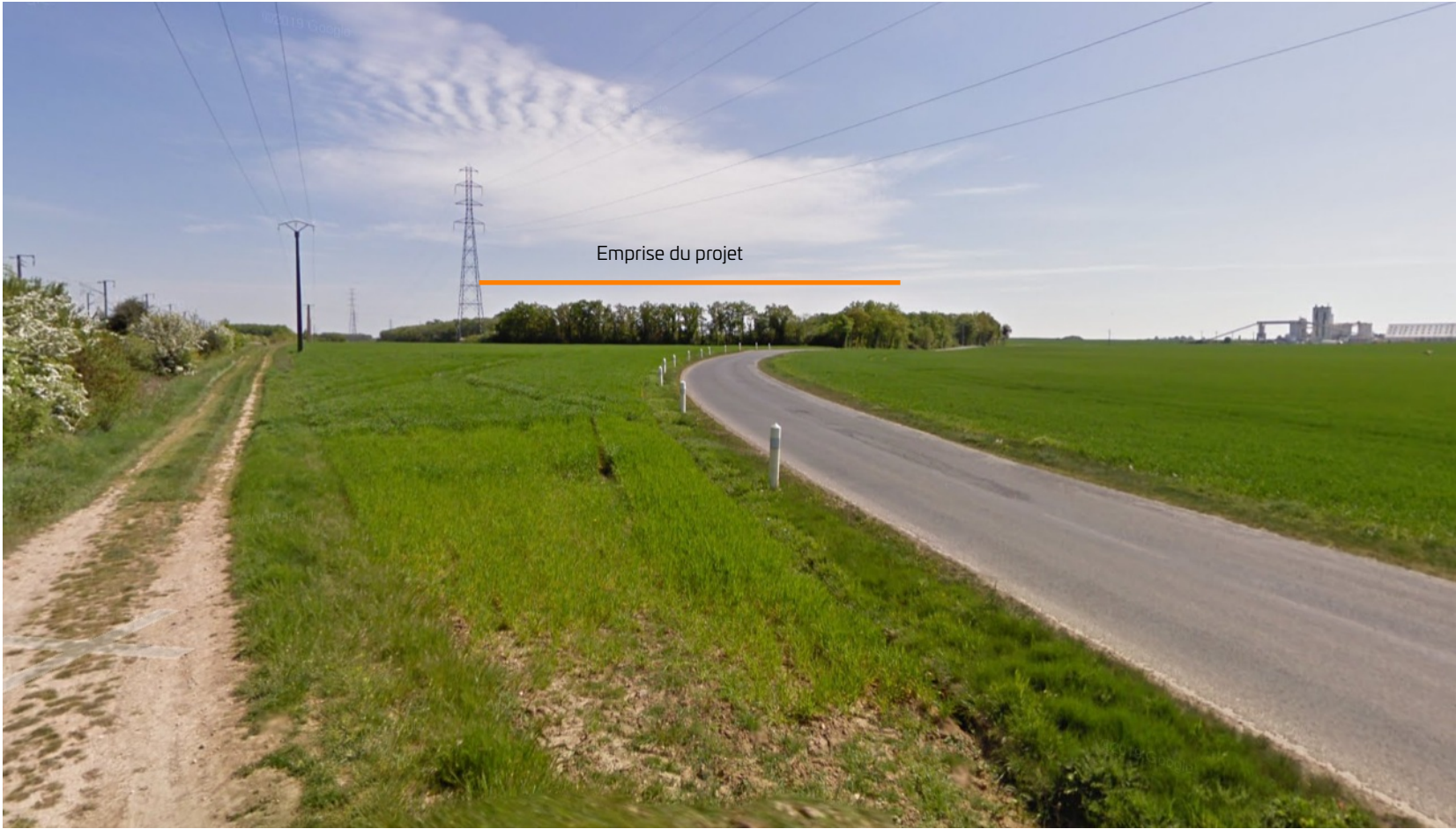
PDV 2 - Localisation du projet dans son environnement lointain (mai 2023)