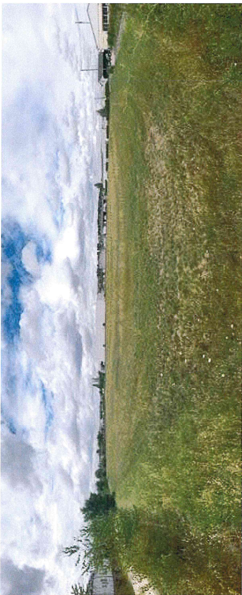
Photo 3 - panoramique