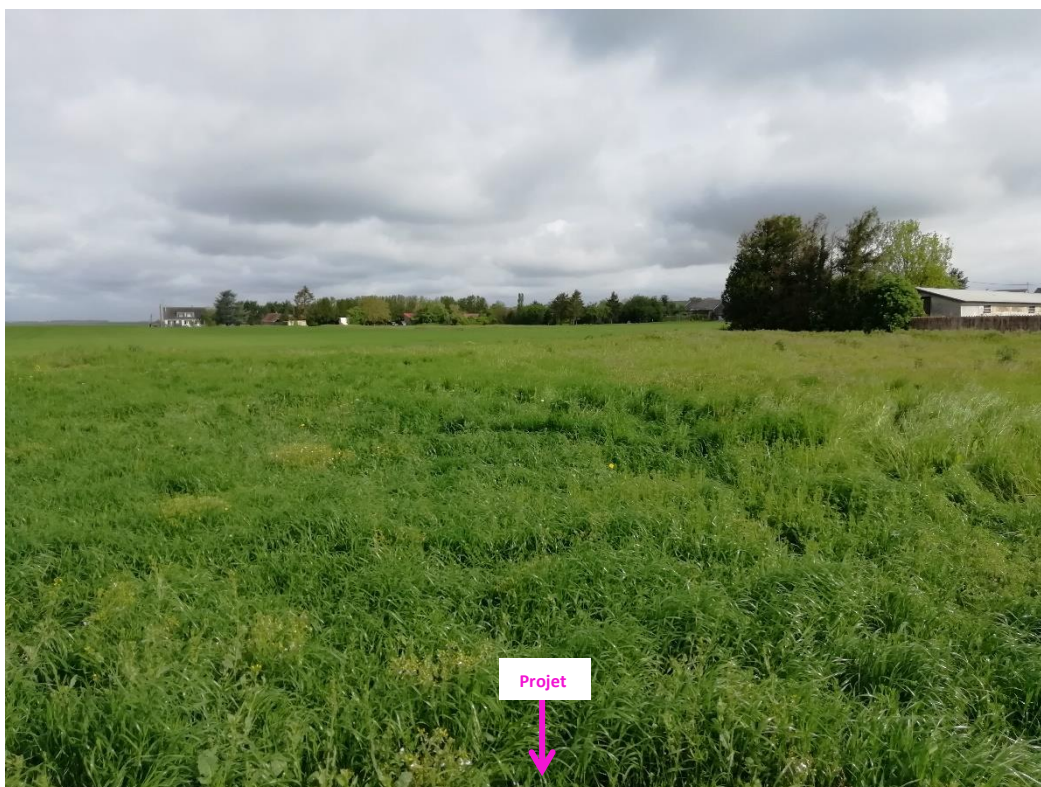
Photographies du 11/05/2023 permettant de situer le projet dans son paysage lointain