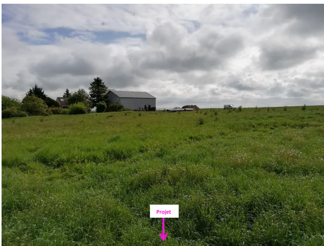
Photographies du 11/05/2023 permettant de situer le projet dans son paysage lointain