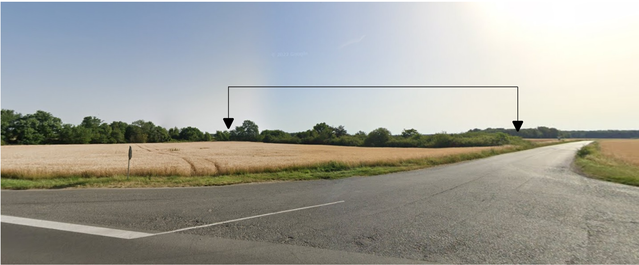
PDV 1 - Localisation du projet dans son environnement proche