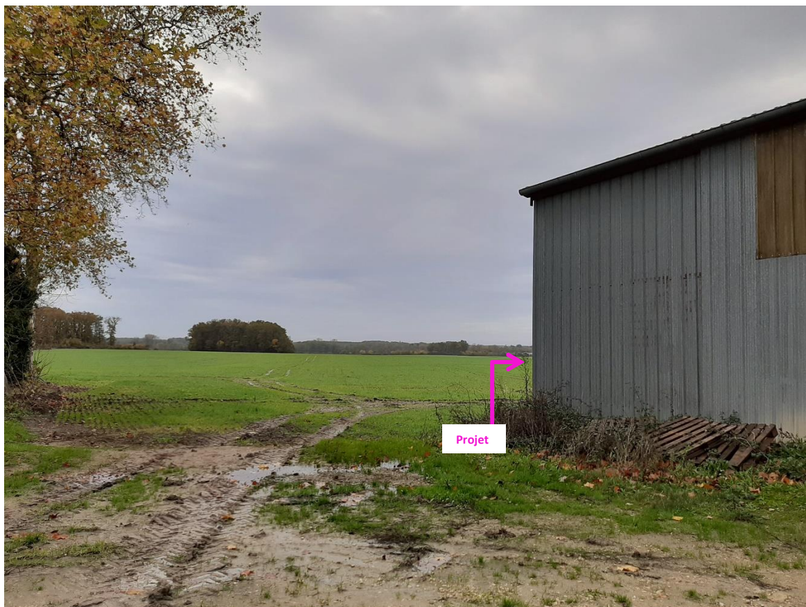
Photographies du 21/11/2022 permettant de situer le projet dans son paysage lointain, prise par la Chambre d'agriculture du Loiret