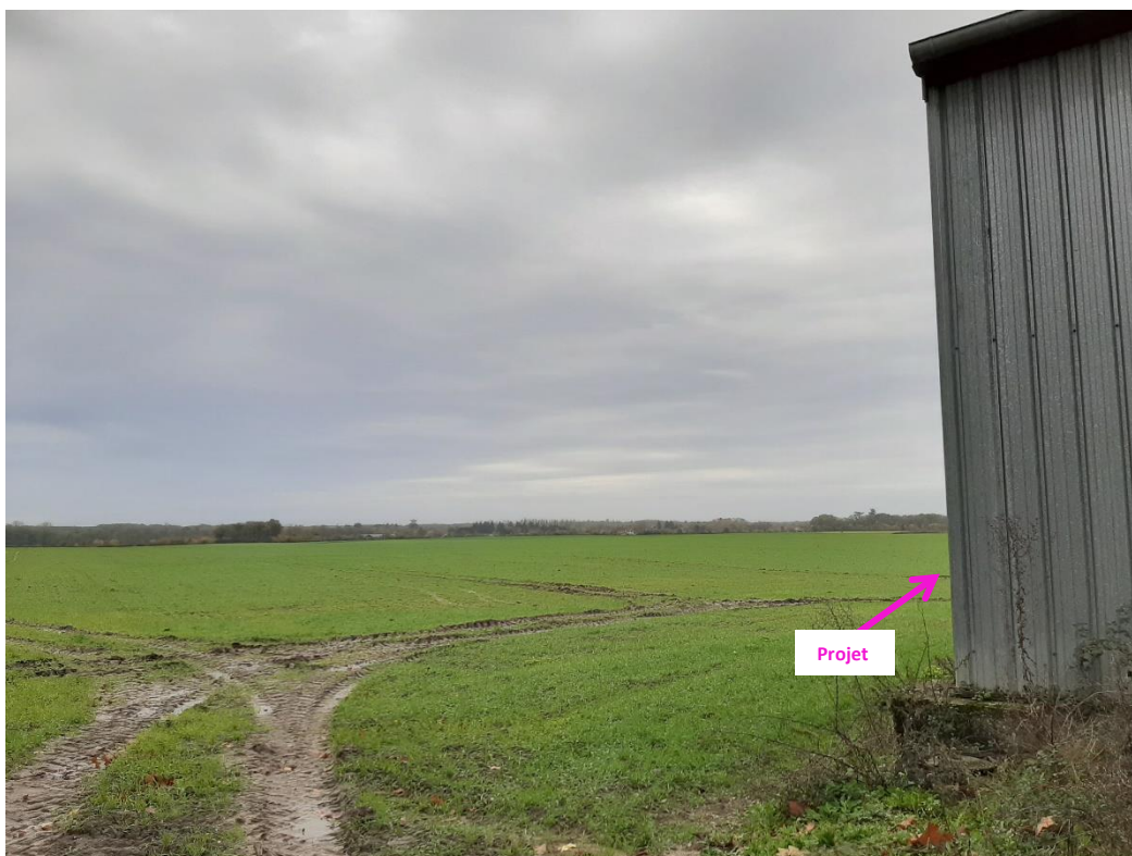
Photographies du 21/11/2022 permettant de situer le projet dans son paysage lointain, prise par la Chambre d'agriculture du Loiret