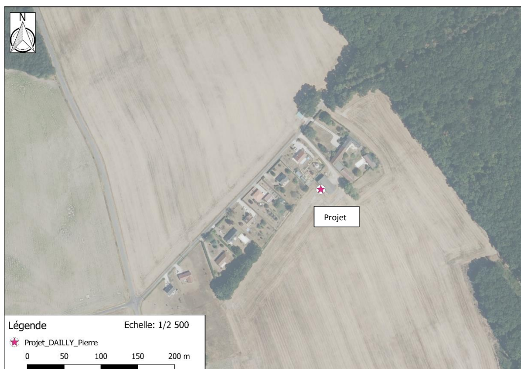
Photographie aérienne extraite de la BDORTHO IGN de 2015 permettant de situer le projet (en rose) dans son environnement proche