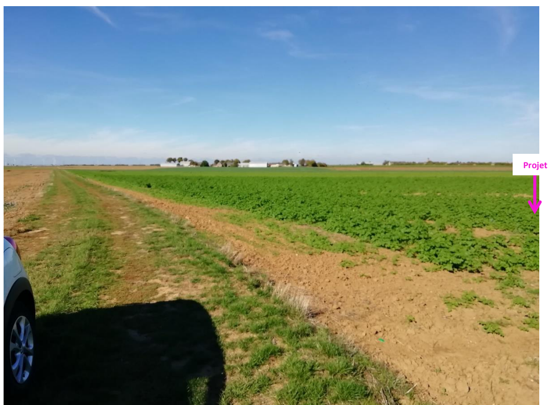
Photographies du 04/10/2022 permettant de situer le projet dans son paysage lointain, prise par la Chambre d'agriculture du Loiret