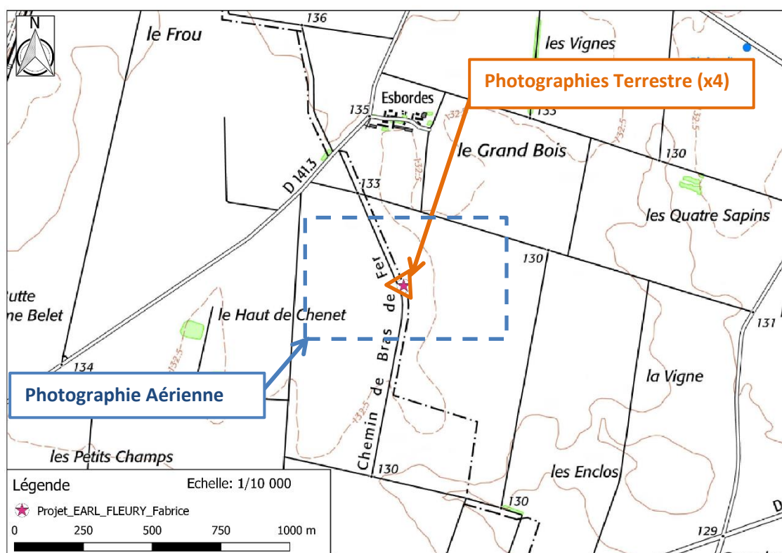
Fond de carte permettant de situer les photographies du site du projet (en rose) dans son environnement