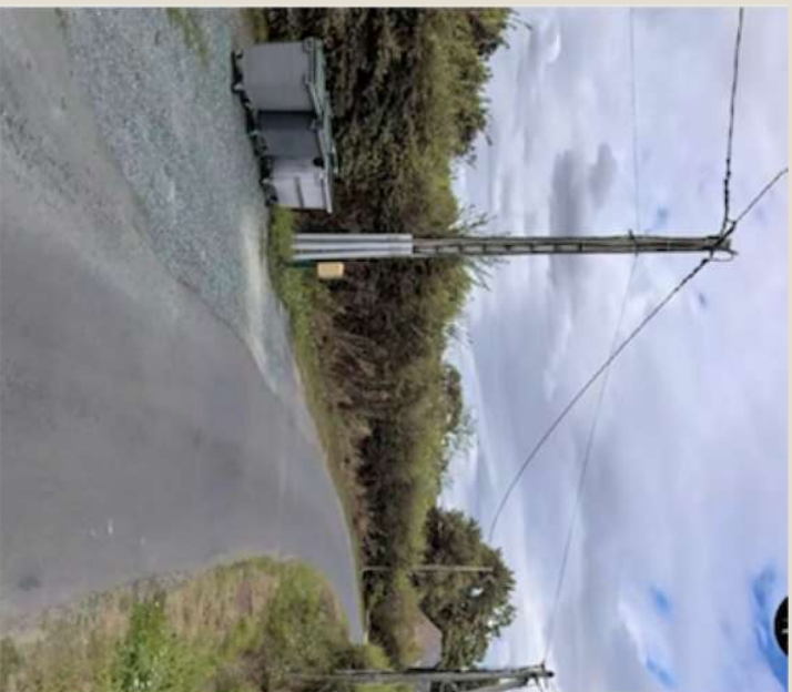
Photographie n° 1