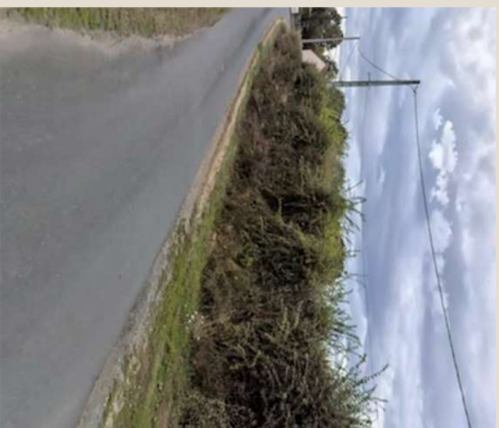
Photographie n° 2