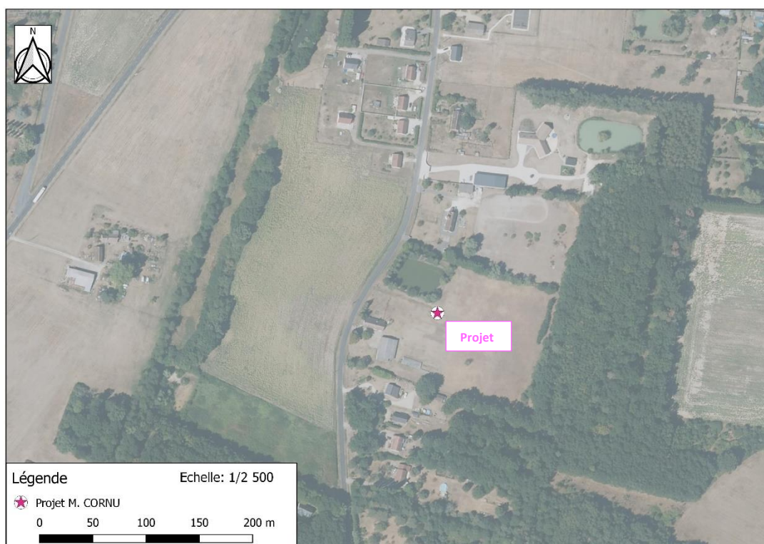
Photographie aérienne extraite de la BDORTHO IGN de 2015 permettant de situer le projet (en rose) dans son environnement proche.