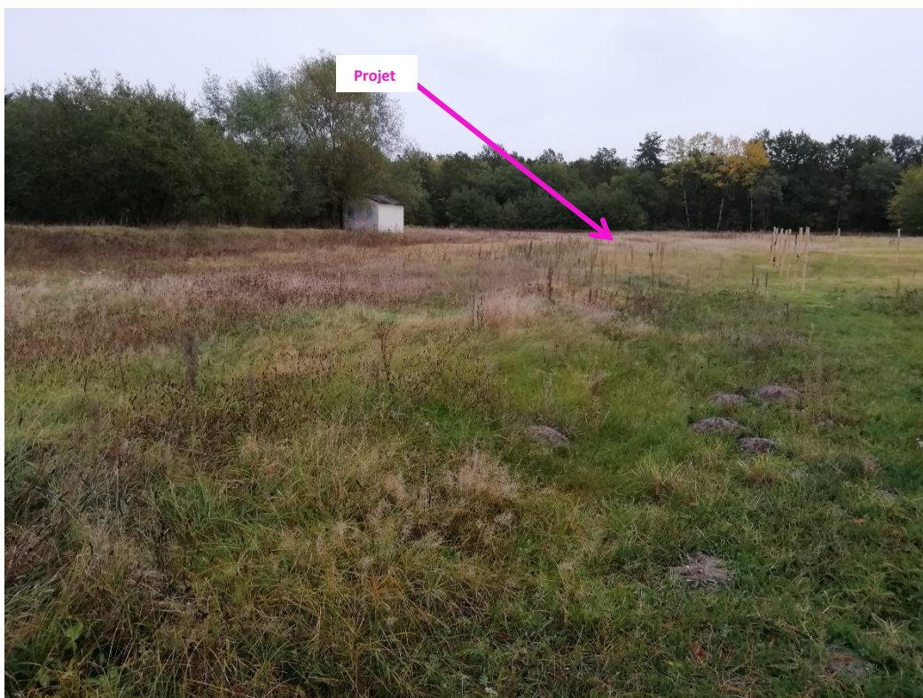
Photographies 23 octobre 2023 permettant de situer le projet dans son paysage lointain