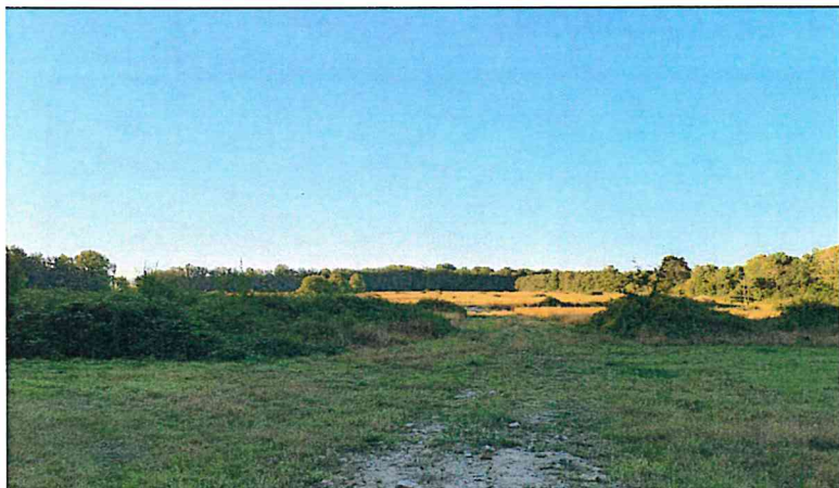
Photo 2: Environnement proche 46.574262 , 1.425728