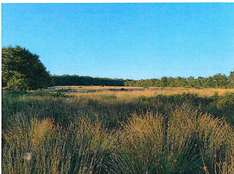
Photo 3: Environnement proche 46.583834 , 1.425091