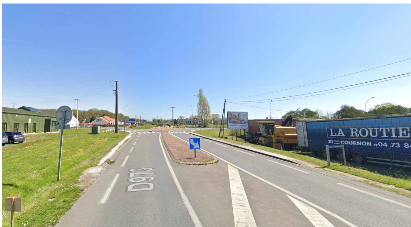
3- Vue depuis la rue du Docteur Schweitzer