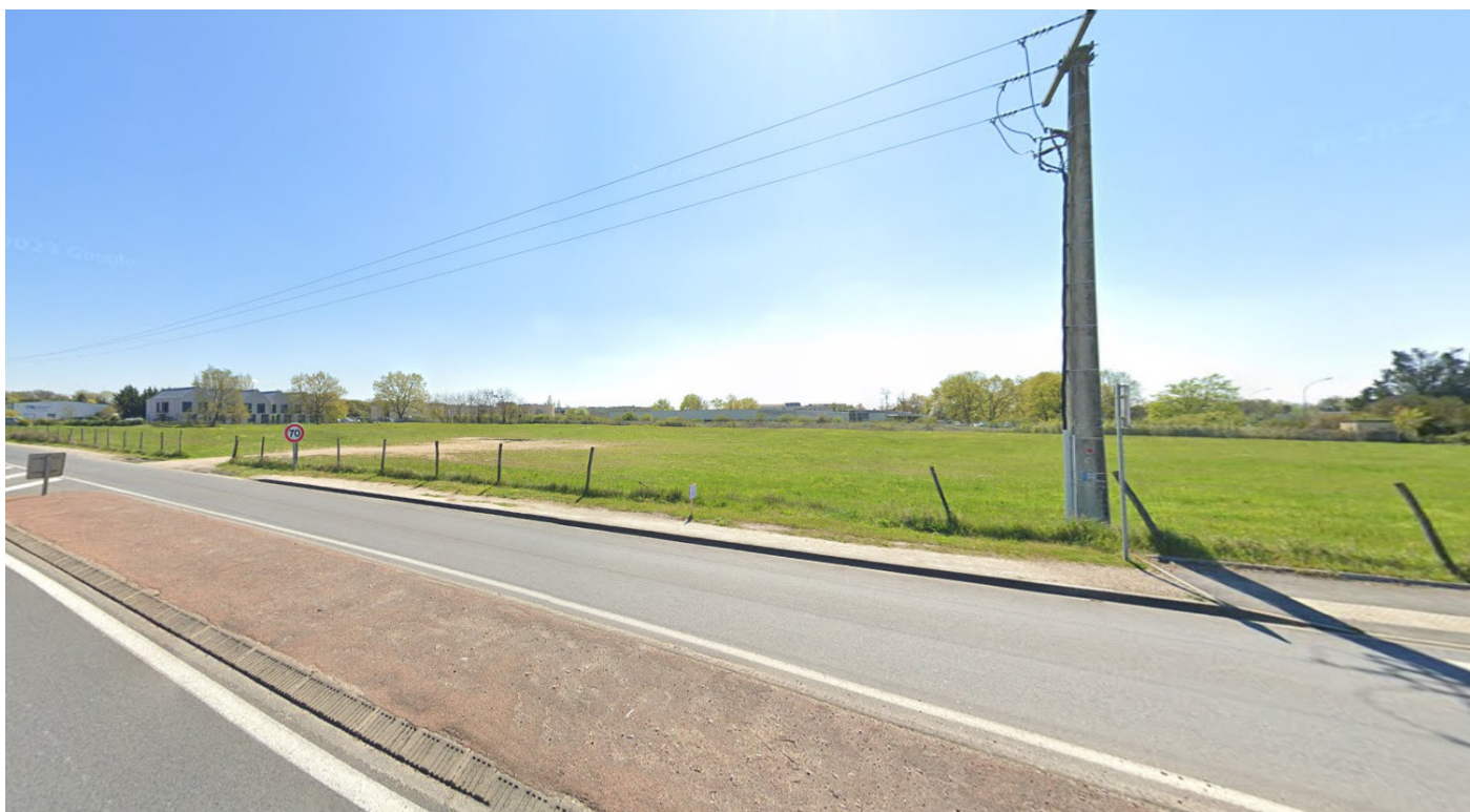
1- Vue depuis la rue du Docteur Schweitzer