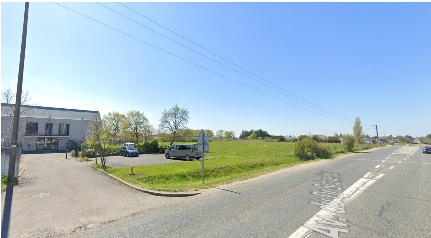
2- Vue depuis la rue du Docteur Schweitzer