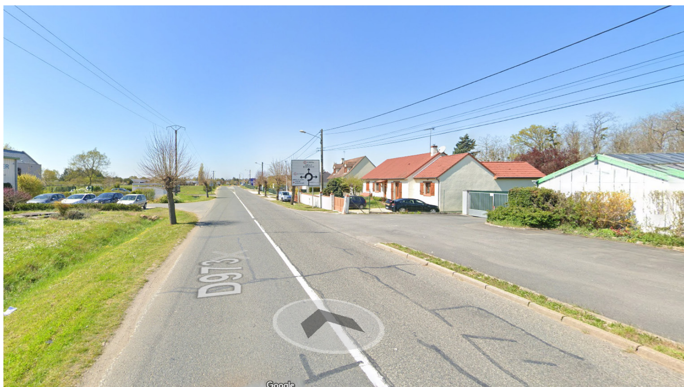
4- Vue depuis la rue du Docteur Schweitzer