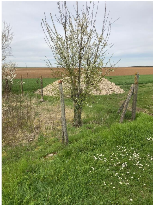
Photographies du 25 mars 2024 permettant de situer le projet dans son paysage lointain, prise par la Chambre d'agriculture du Loiret