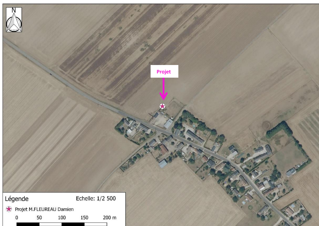
Photographie aérienne extraite de la BDORTHO IGN de 2022 permettant de situer le projet (en rose) dans son environnement proche