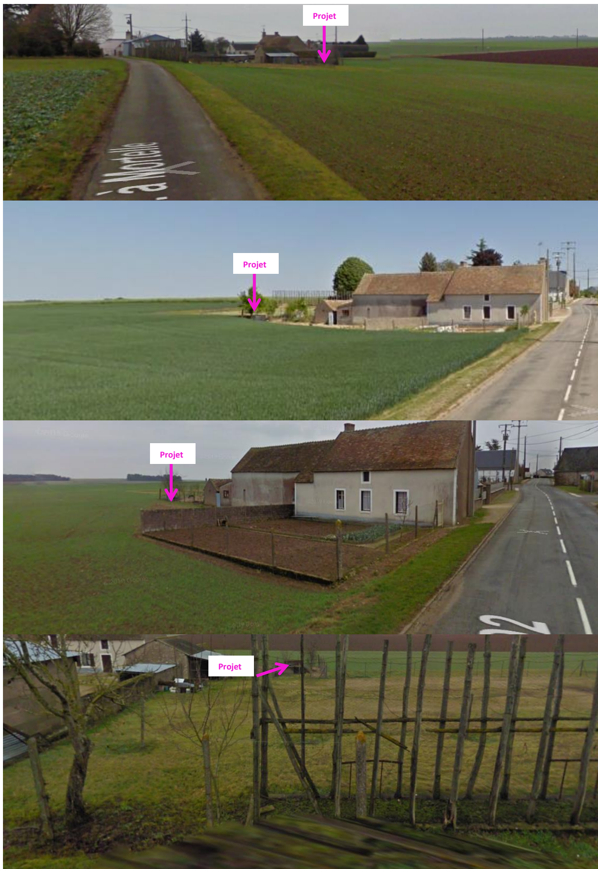
Photographies issues de Google Maps (Mars et mai 2011) permettant de situer le projet dans son paysage lointain.