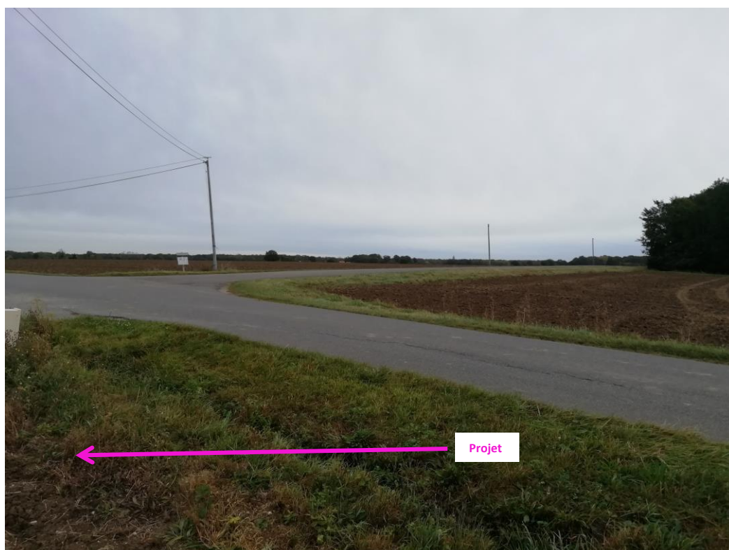
Photographies 23 octobre 2023 permettant de situer le projet dans son paysage lointain, prise par la Chambre d'agriculture du Loiret