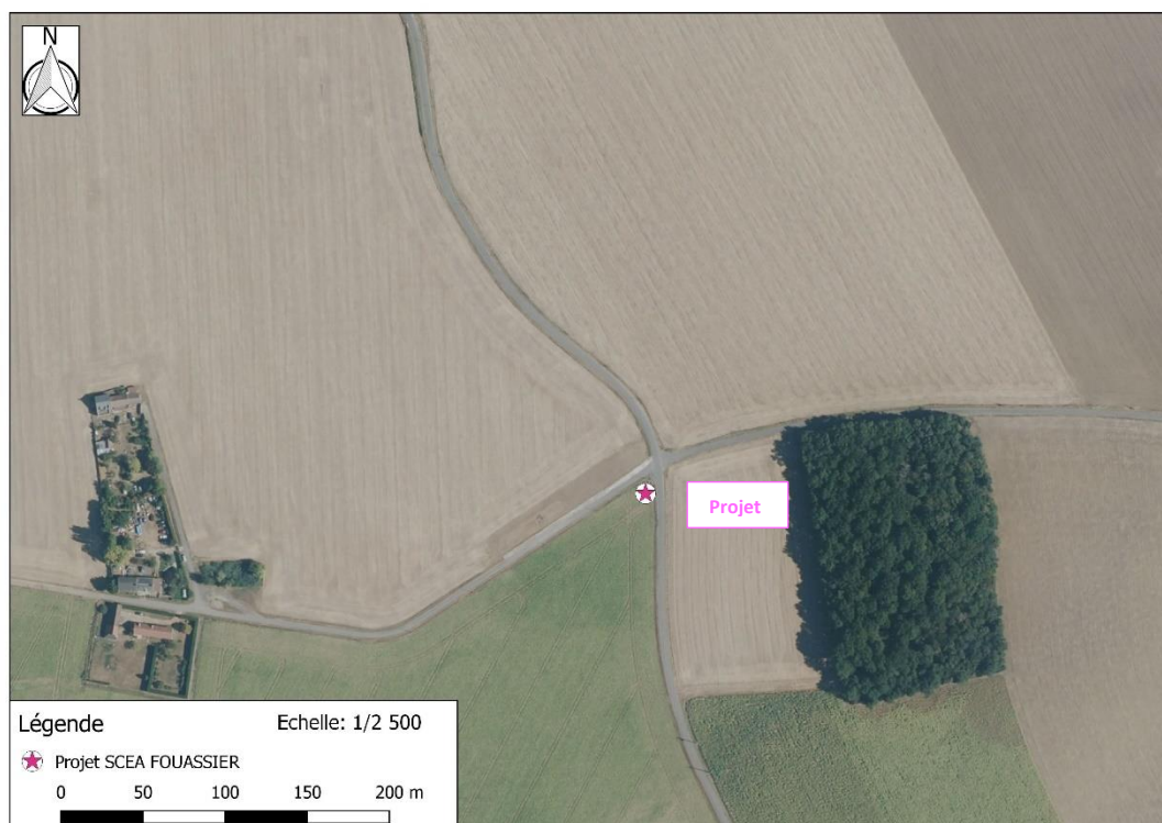
Photographie aérienne extraite de la BDORTHO IGN de 2015 permettant de situer le projet (en rose) dans son environnement proche.