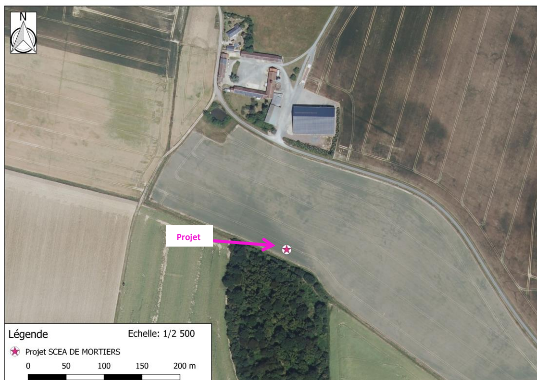
Photographie aérienne extraite de la BDORTHO IGN de 2015 permettant de situer le projet (en rose) dans son environnement proche