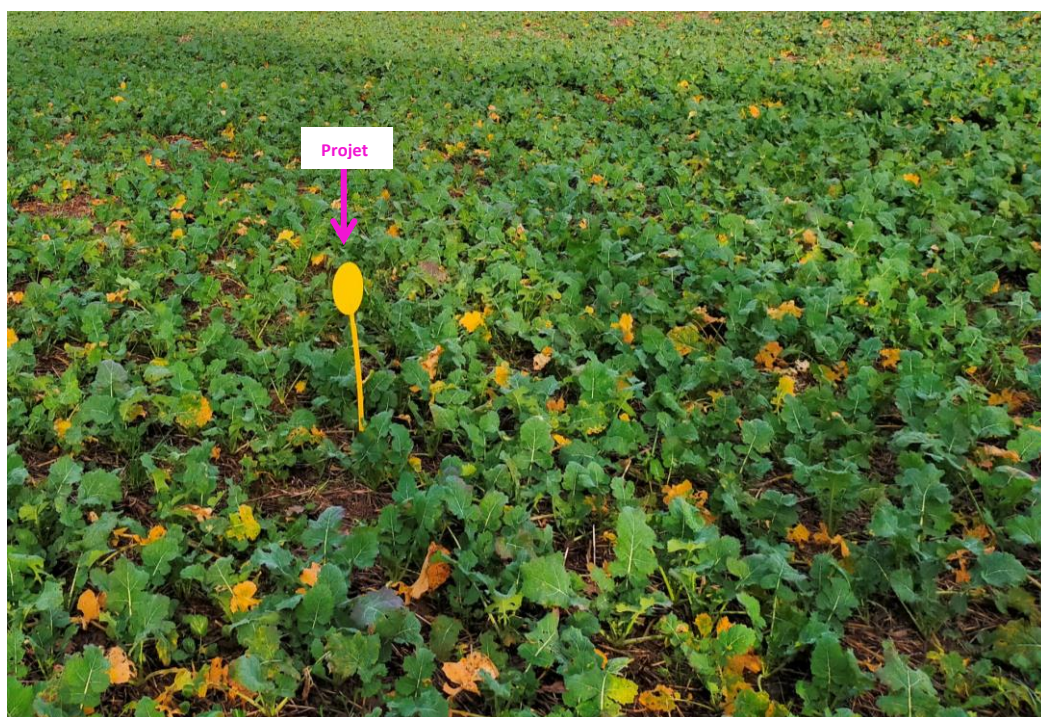
Photographies du 14/12/2023 permettant de situer le projet dans son paysage lointain