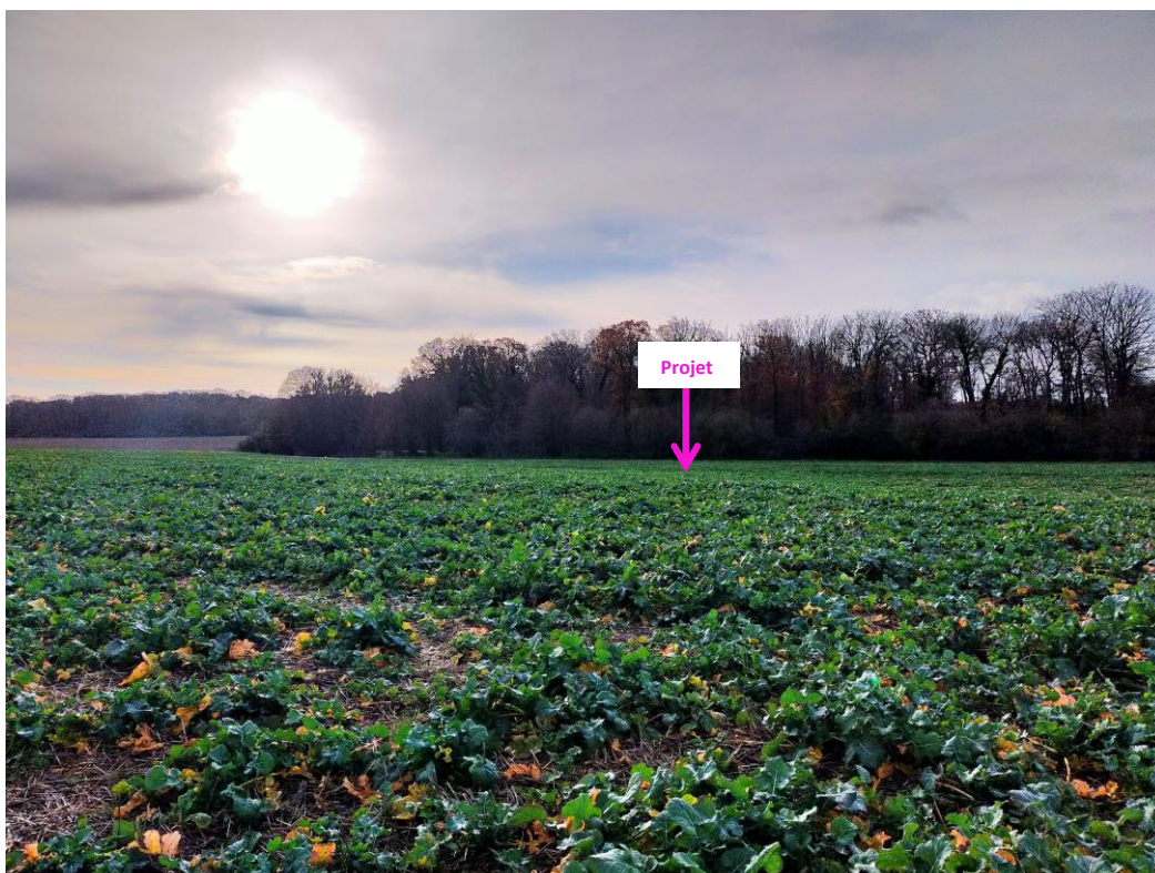
Photographies du 14/12/2023 permettant de situer le projet dans son paysage lointain