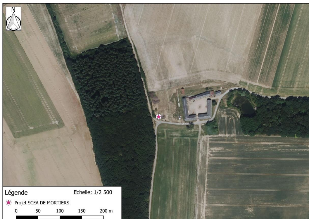
Photographie aérienne extraite de la BDORTHO IGN de 2015 permettant de situer le projet (en rose) dans son environnement proche