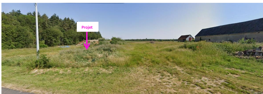
Photographies de juin 2023 permettant de situer le projet dans son paysage lointain