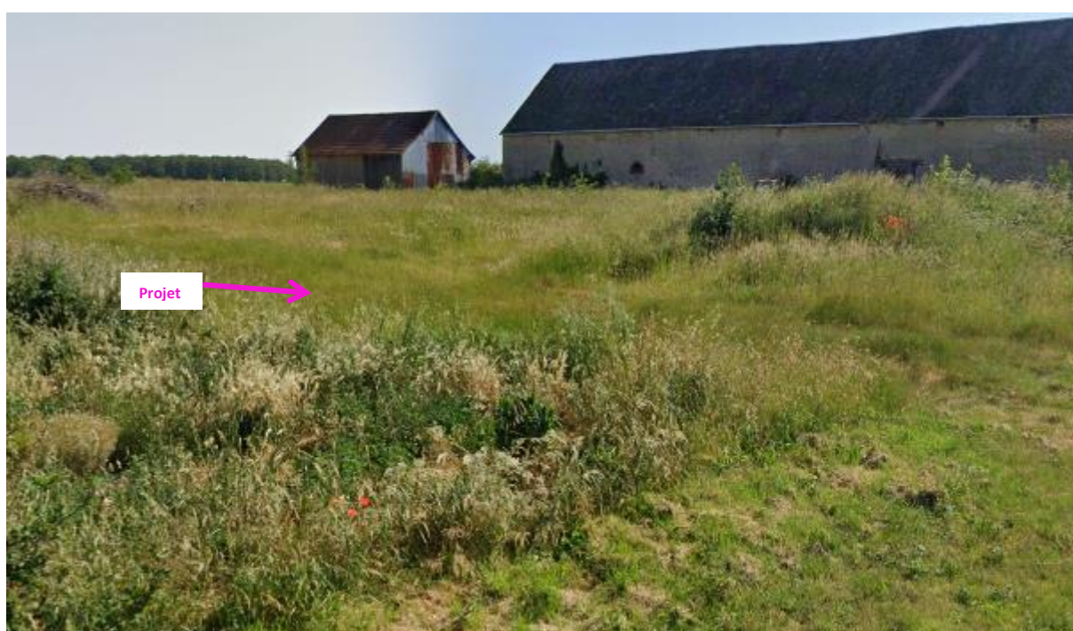
Photographies de juin 2023 permettant de situer le projet dans son paysage lointain