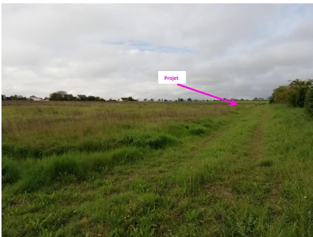
Photographies du 07 mai 2024 permettant de situer le projet dans son paysage lointain