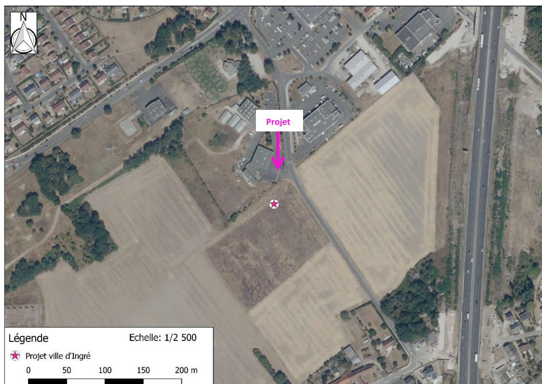
Photographie aérienne extraite de la BDORTHO IGN de 2022 permettant de situer le projet (en rose) dans son environnement proche