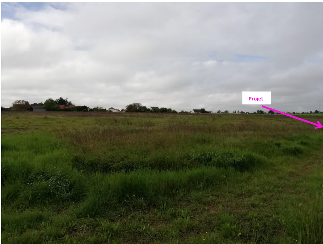
Photographies du 07 mai 2024 permettant de situer le projet dans son paysage lointain