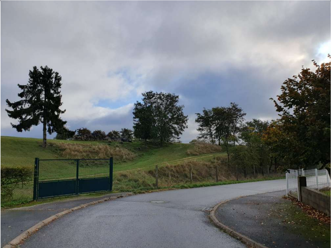
PDV 1 - Localisation du projet dans son environnement proche