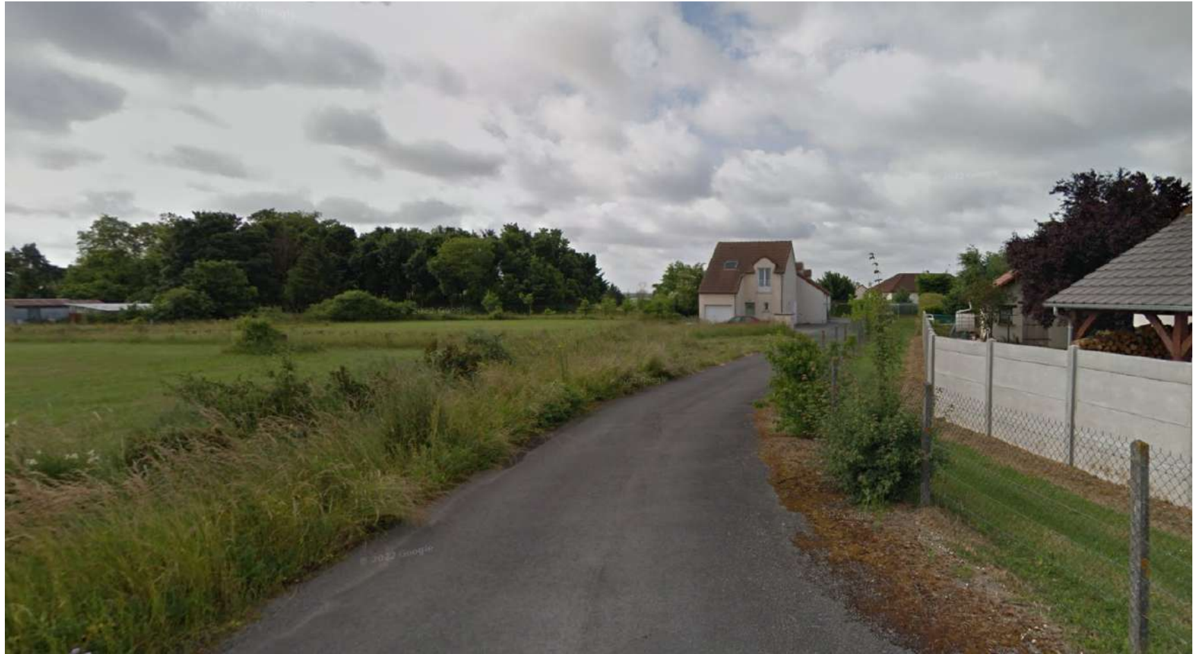
PDV 2 - Localisation du projet dans son environnement lointain