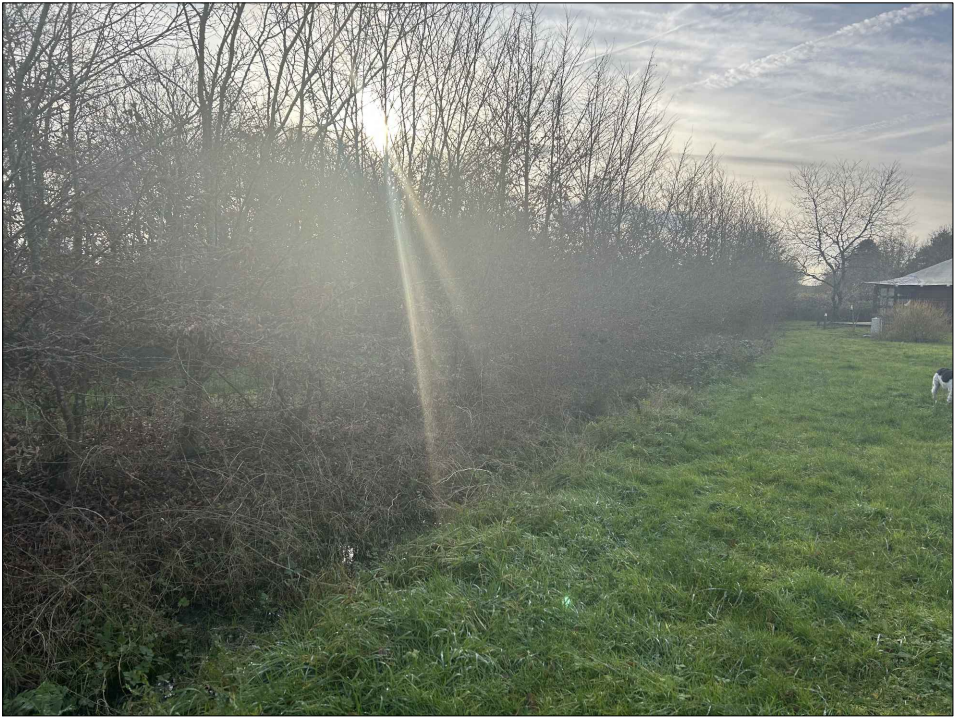
Photographie n°2 - Environnement lointain datant du 03/01/2025