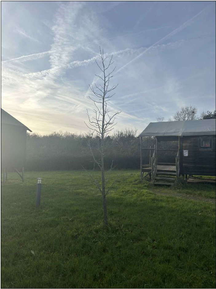
Photographie n°1 - Environnement proche datant du 03/01/2025