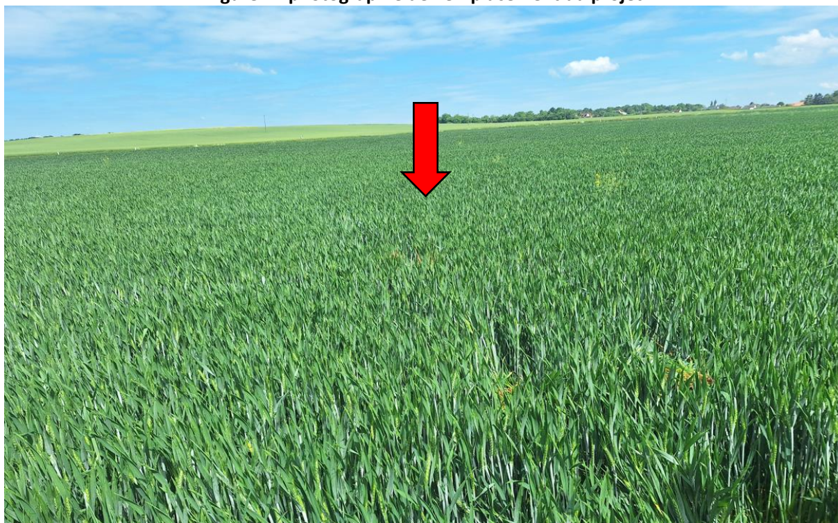
Figure 1 : photographie de l'emplacement du projet