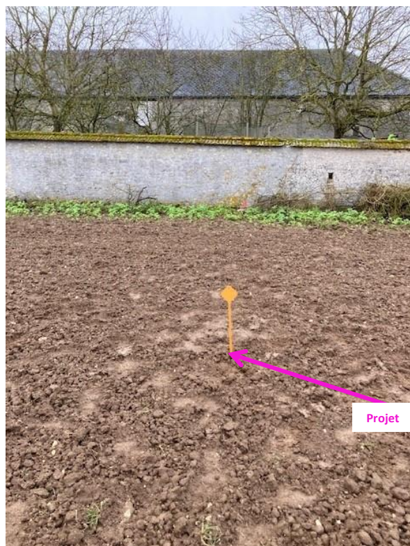
Photographies du 23/04/2024 permettant de situer le projet dans son paysage lointain