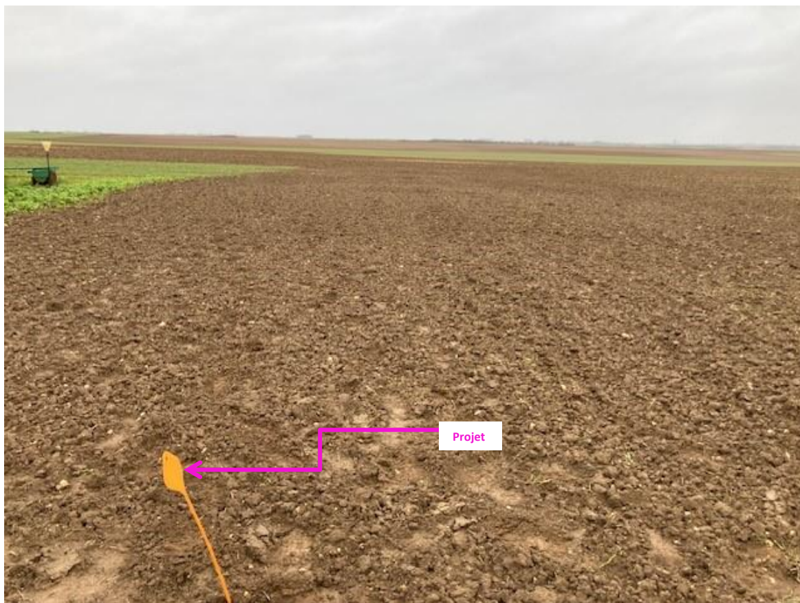
Photographies du 23/04/2024 permettant de situer le projet dans son paysage lointain