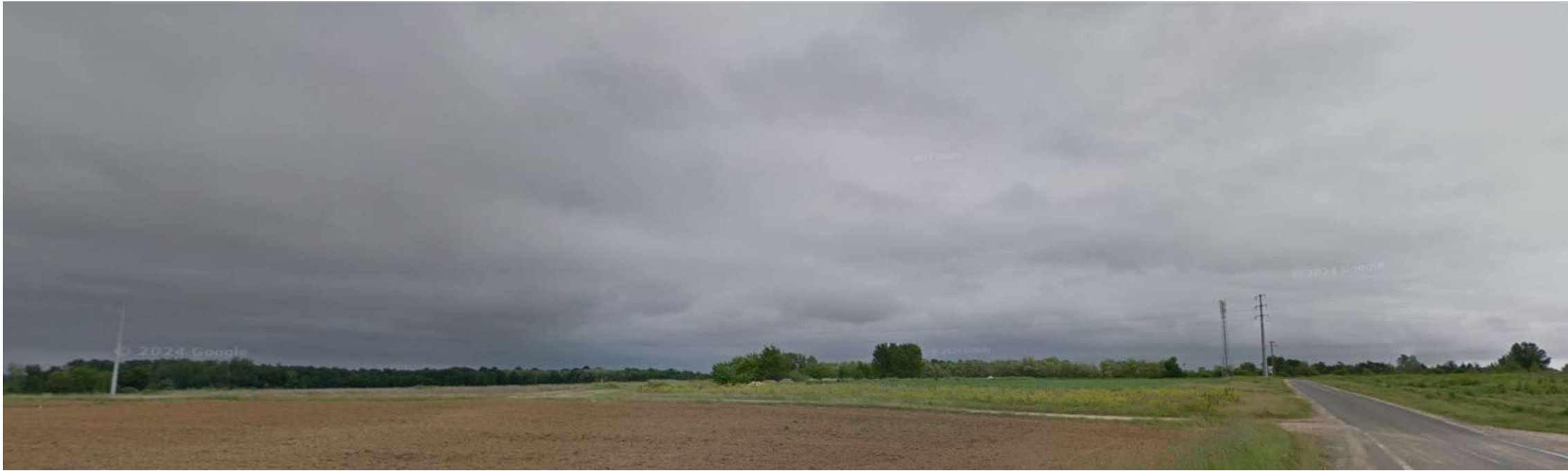
PDV 2 - Localisation du projet dans son environnement lointain