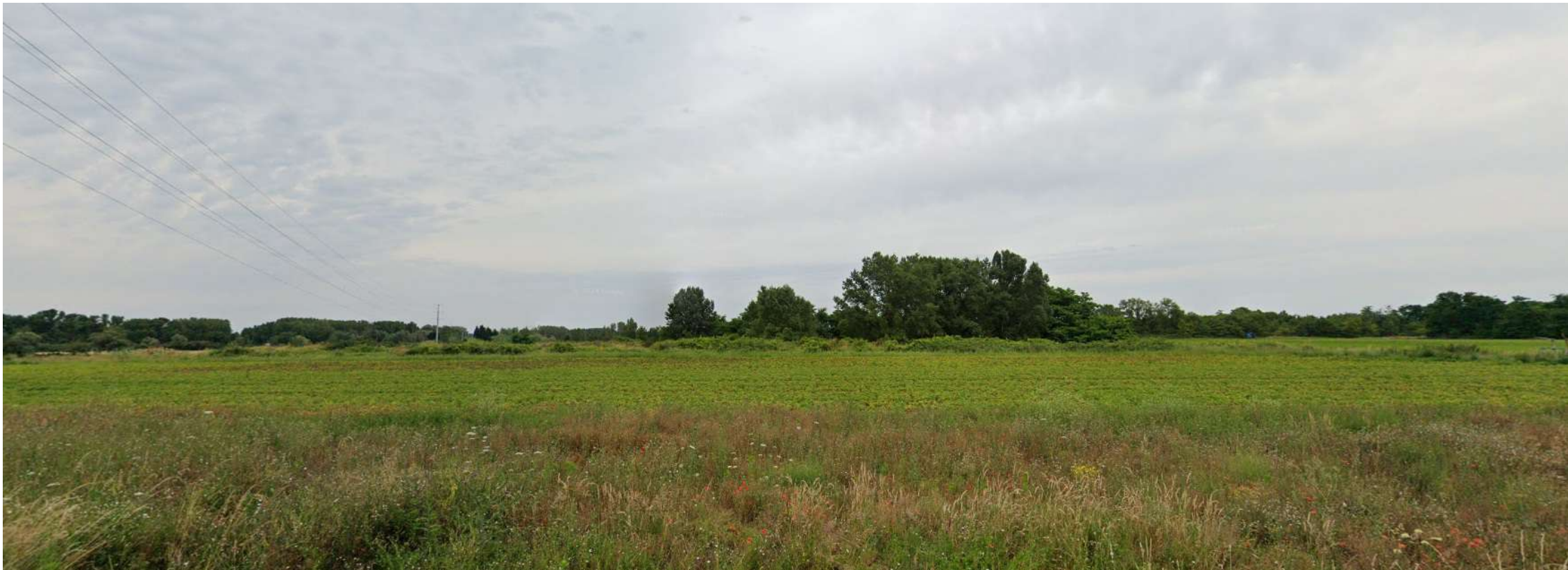
PDV 1 - Localisation du projet dans son environnement proche